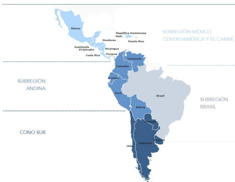
Cuadro. No. 1 Subregiones de la ODUICAL